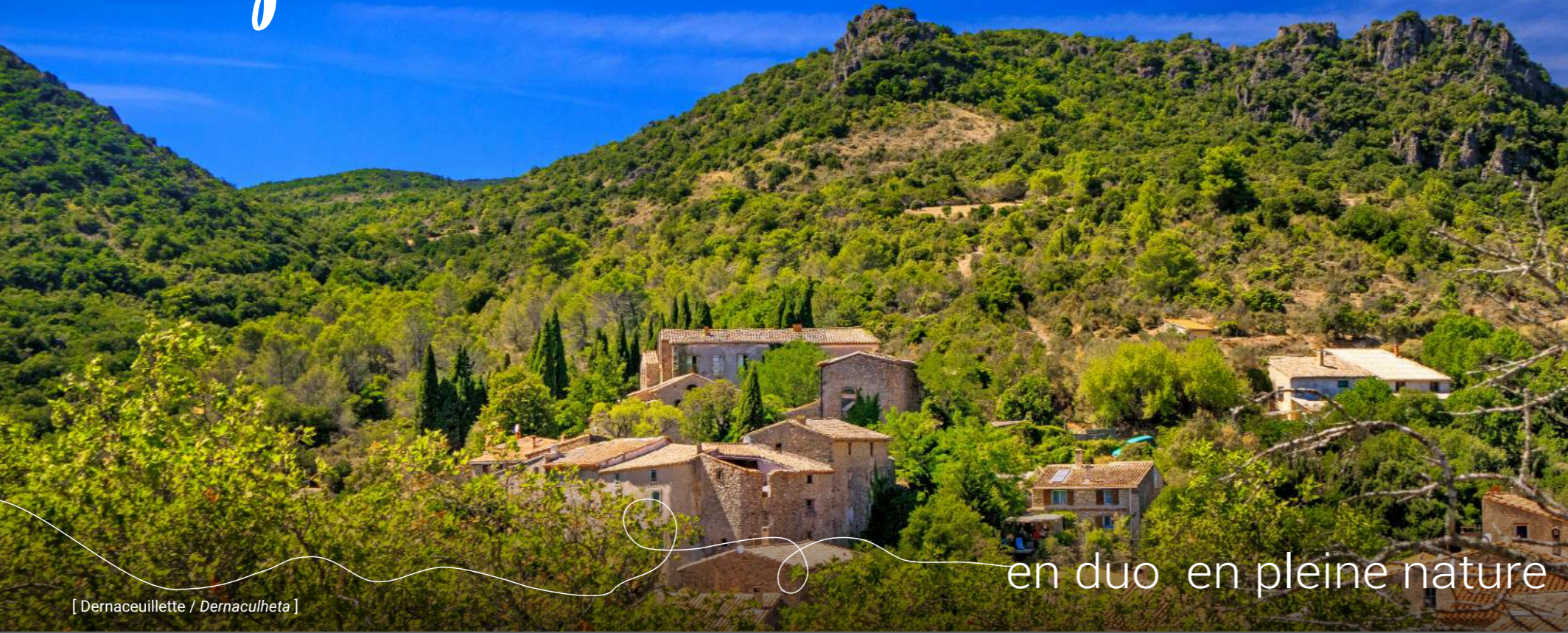
[ Dernaceuillette / Dernaculheta ]